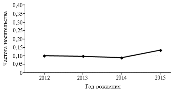
Рис. 3. Частота носительства мутации дефицита холестерина HCD среди голштинизированных черно-пестрых коров разных лет рождения (Ленинградская обл., 2017 год).

HCD составила соответственно 1100,8; 42,5 и 28,3 кг, а для животных HCD - — 1030,5; 39,3 и 27,1 кг. То есть у первых она была выше по удою на 6,8 %, по жиру — на 8,1 %, по белку — на 4,8 %. Дисперсионный анализ (табл. 2) показал стойкий положительный эффект влияния носительства по HCD на продуктивность.