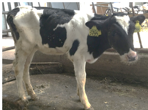
Рис. 2. Телка голштинизированной черно-пестрой породы, гомозиготная по мутантному аллелю гена APOB , с типичными клиническими проявлениями синдрома дефицита холестерина (отставание в росте и развитии, истощение, диарея) (Ленинградская обл., 2017 год).

предков матери был бык Maughlin Storm 5457798 среди предков отца — Breadale Goldwyn 10705608. Эти быки и их потомки используются в системе искусственного осеменения в России уже несколько лет и отмечены как скрытые носители HCD.