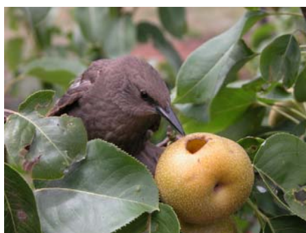
Рис. 4. Молодой скворец, клюющий грушу (штат Новый Южный Уэльс, Австралия). Скворцы относятся к числу наиболее вредных птиц, они наиболее опасны для садоводства (поедают виноград, вишню, сливу, черешню, абрикосы, яблоки и т.д.). Фото В. Lukins, 30 января 2004 года.

Опасность некоторых видов может быть чрезвычайно большой. Например, красноклювый ткачик ( Quelea quelea ), родом из Африки, является самым многочисленным вредителем. Эти птицы образуют кочевые колонии численностью до 30 млн особей. Они питаются сорго, пшеницей, ячменем, рисом, подсолнечником и кукурузой. Стая из 2 млн особей может потреблять 50 т зерна в сутки, за что их иногда называют пернатой саранчой (39). В Шотландии грачи съедают до 25 % посеянного овса и 20 % ячменя. В США потери зерновых от краснокрылых трупалов в среднем составляют 16,2 % (40). По подсчетам Ю.М. Маркина (41), серые журавли ( Grus grus L.) на территории европейской части России ежегодно уничтожают 60 т зерна.