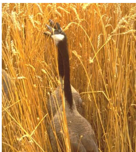
Рис. 3. Канадские гуси на пшеничном поле в штате Колорадо (США). Это не приоритетные вредители зерновых, но они поедают как молодые ростки, так и зерно.

Значительную часть ущерба составляет элементарное вытаптывание. Например, в районе Салакпры (запад Таиланда) в 2006 году зарегистрированы 462 нашествия слонов на фермерские поля (33). Слоны также используют плодовые деревья и кустарники, чтобы ставить метки. Иногда они валят их, чтобы продемонстрировать или испытать силу либо для эмоциональной разрядки.