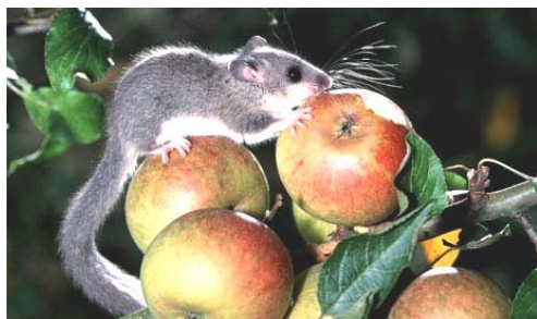
Рис. 2. Соня-полчок, поедающая яблоко (Великобритания). Животное питается грецкими орехами, каштанами, ягодами, плодами (груши, яблоки, виноград, черешня, слива, туютовник). Каждая соня-полчок на Северном Кавказе съедает за лето 400 груш. сентябрь 2010 года.

В штате Раджастан (Индия) ущерб овощным культурам от грызунов на различных культурах колеблется от 4,1 до 19,9 %, составляя в среднем 8,7 %. Основными вредителями при этом — индийская полевая мышь ( Mus booduga Gray) и песчанка ( Gerbillus leadowi ), а главные повреждаемые культуры — помидоры и баклажаны (12).