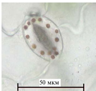
Рис. 2. Хлоропласты в замыкающих клетках устьиц (эпидермальная ткань листа сахарной свеклы Beta vulgaris L.).

Апозиготические семенные потомства, как правило, имеют диплоидное (дигаплоидное) число хромосом в клетках, поскольку возникают из эндотетраплоидных клеток археспория. Наряду с дигаплоидными часть семян, воспроизводимых апозиготически, — гаплоидные (16, 17). Гаплоидные проростки в 4 раза короче и имеют вдвое меньший диаметр, чем сестринские дигаплоидные (рис. 1).