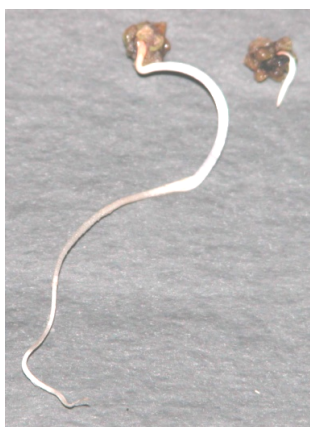
Рис. 1. Диплоидный (слева) и гаплоидный (справа) проростки сахарной свеклы ( Beta vulgaris L.).

где f_i и f_i' — соответственно эмпирические и теоретические частоты конкретных распределений по исследуемому признаку (21).