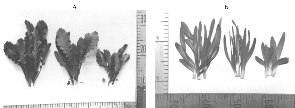
Рис. 2. Листовая горчица сорта Волнушка (А) и лук-слизун линии 525 (Б), выращенные в условиях фитотрона при ночной температуре воздуха 5, 10, 15 °С (справа налево); дневная температура — 22 °С.

лость наступала на 7-10 сут позднее (рис. 1, 2, табл.).