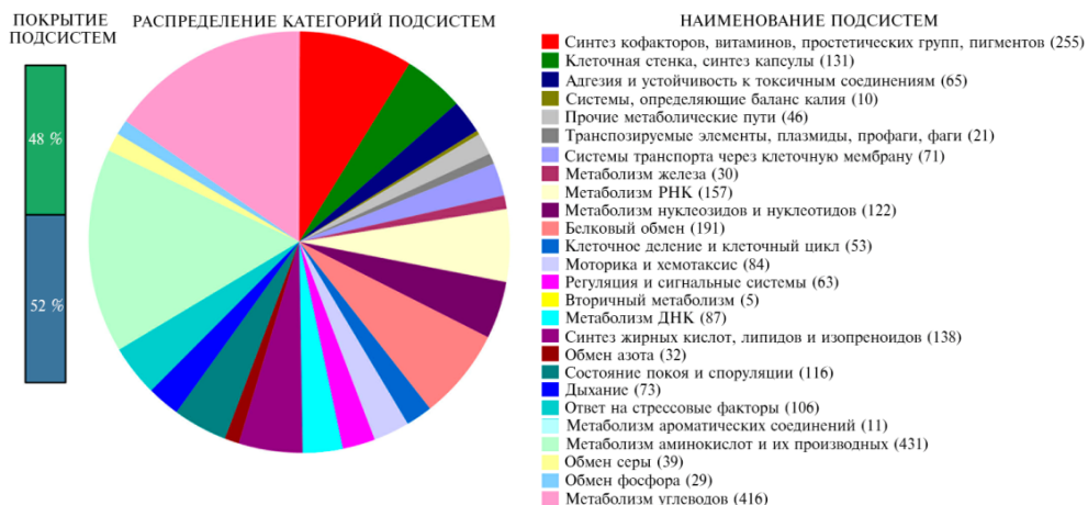
Рис. 3. Распределение категорий подсистем клеточного метаболизма у штамма Bacillus velezensis KP-2 на основе результатов функциональной аннотации генома с помощью веб-сервиса RAST ( https://rast.nmpdr.org ). Круговая диаграмма представляет процентное содержание белков для каждой категории подсистем. Категории подсистем перечислены в легенде сверху вниз согласно направлению движения по круговой диаграмме по часовой стрелке. Цифры в скобках — число метаболических путей в соответствующей категории подсистемы. Покрытие подсистем — соотношение известных белков, которые могут быть помещены в существующие подсистемы (зеленый цвет), и неизвестных белков, которые не могут быть помещены ни в одну существующую подсистему (синий цвет).

ческие подсистемы — группы белков, которые совместно обеспечивают реализацию определенного биологического процесса (рис. 3). Среди категорий подсистем, присутствующих в геноме, наиболее представленными были подсистемы метаболизма аминокислот и их производных (431 подсистема) и метаболизма углеводов (416 подсистем).