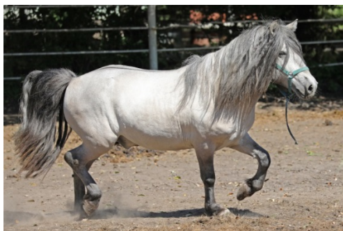
Рис. 1. Жеребец якутской породы на экспериментальной конюшне Всероссийского НИИ коневодства (Рязанская обл.).

Результаты. При генотипировании якутских лошадей (рис. 1) по гену MC1R мы идентифицировали три генотипа: 25 лошадей имели гомозиготный по доминантному аллелю дикого типа генотип E/E , 6 лошадей были гомозиготами по рецессивному мутантному аллелю (генотип e/e ) и 14 лошадей имели гетерозиготный генотип E/e . Большинство исследованных животных (39 гол.) оказались носителями доминантного аллеля E , детерминирующего выработку черного пигмента эумеланина. При этом частота встречаемости мутации С>Т в гене MC1R (аллель e ), детерминирующей подавление синтеза пигмента эумеланина, составила в группе исследованных лошадей 0,289 (табл. 1).